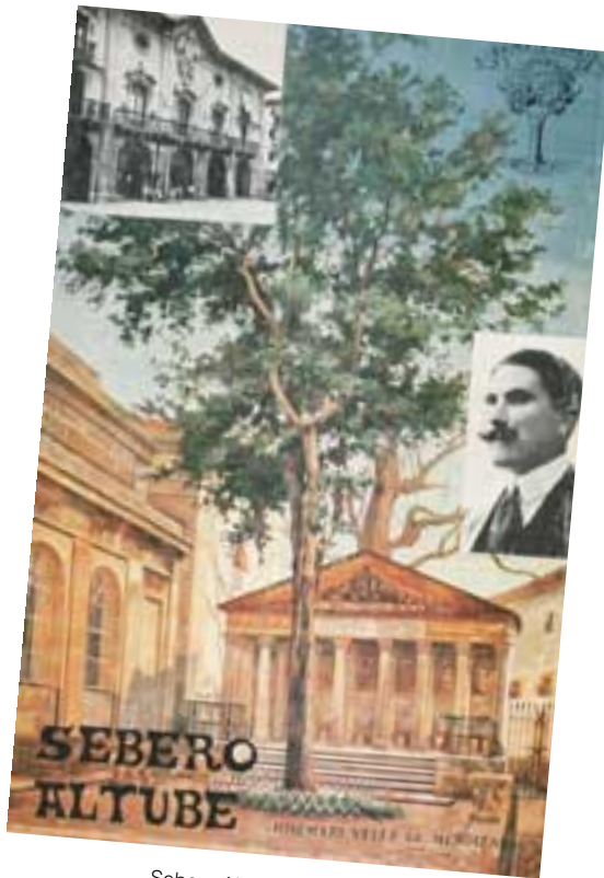
Sebero Altuberen biografia eta bibliografia biltzen dituen liburua.

Oharra: Sebero Altuberen bibliografia osoa SEBERO ALTUBE (Josemari Velez de Mendizabal. CAMSS .1979) liburuan aurki daiteke.