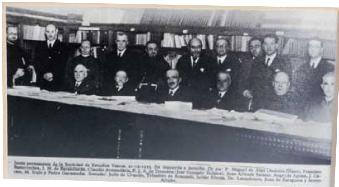
Eusko Ikaskuntzaren batzar batean