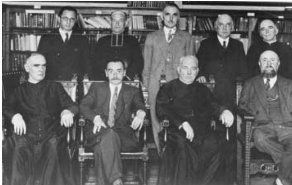
Euskaltzaindiaren batzar batean