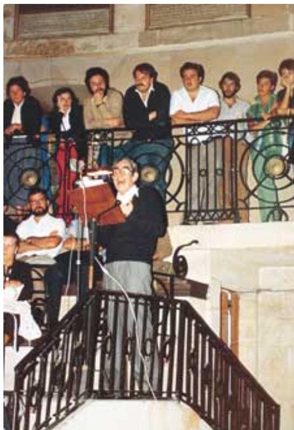
Gernikako Junta Etxean, beste batzuen artean, Luis Mitxelena hitz egin zuen, 1979ko abuztuaren 27an.