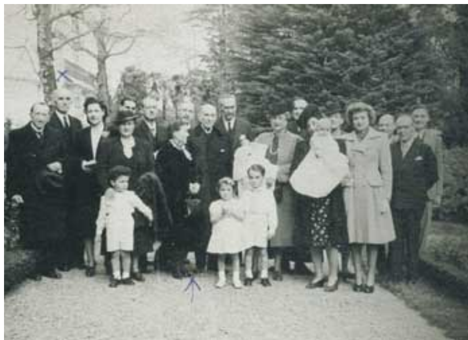
Erbestera doaz Altubetarrak 1936ko irailaren 29an. Lehenik Baionara, gero Argentinara eta, azkenik, Frantziako Pauera. Ez dira Gernikara 1958ra arte itzuliko.