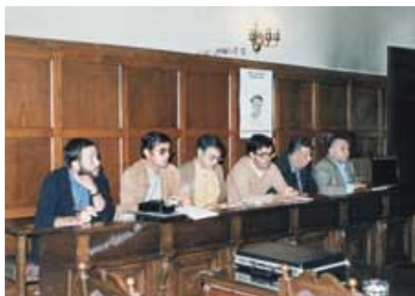
Altuberena mendeurrena ospatu zuen Euskaltzaindiak 1979an. Abuztuan ekin zitzaion egitarauari, Gernikako udaletxean.