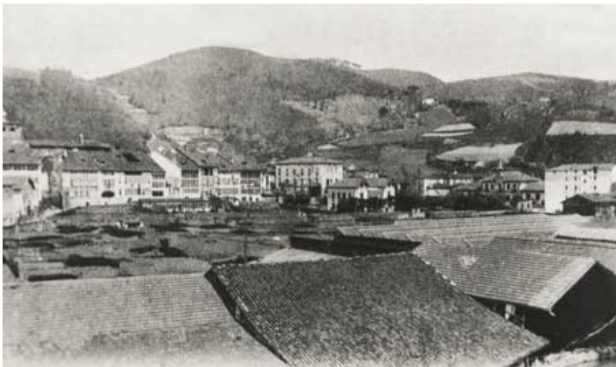
Arrasaten jaio zen Altube, 1879ko azaroaren 8an.