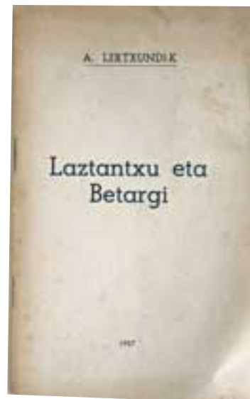
Laztantxu eta Betargi izenburuean, 1936ko gerratearen ostean arrasatear bikote batek bizi zituen zoritxarrak deskribatu zituen Altubek.

Bere jaioterriaren aurkako gerra eraso, fusilamendu eta gainerako gertaera latzetan oinarri zuen Altubek bere literatura obrarik ezagunena: Laztantxu eta Betargi . Oso euskara txukun –agian zailxe samarra den arren– erabili zuen, gertakari lazgarriaren deskribapen historiko fikziozkoa egiteko. Arrasturi izena eman zion idazkian bere Arrasateri. Eta hitzaurrean dioen bezala, liburuan