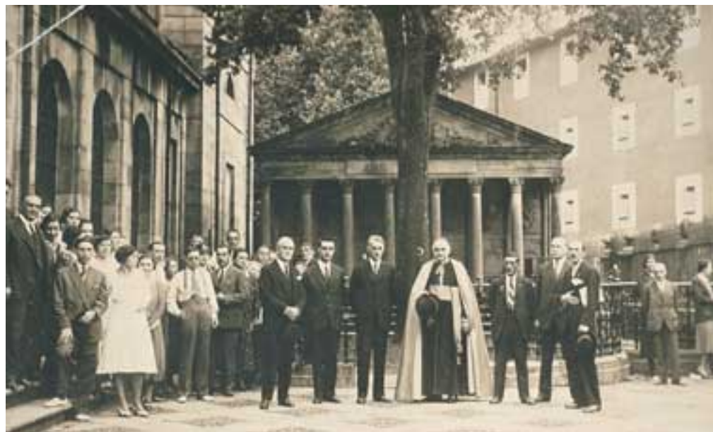
Gernikako alkate aukeratu zuten 1931n eta berak egin zien ongi etorria urte hartako uztailean Gernikara bildutako euskal alkateei.