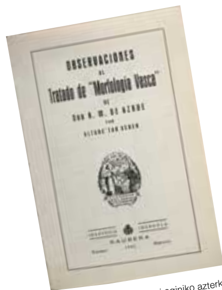
Azkueren Morfología Vasca -ri eginiko azterketa lana bildu zuen Altubek bere argitarapen honetan.

Altubek berak dio, ez duela bere erantzunarekin maisutzat daukan Azkueren kontra ezer jaurti nahi izan, nahiz eta arrasatearraren ekarpenak 230 orrialdeko luzera hartzen duen. Kontuan izan behar da Azkueren obra lau bider luzeagoa zela. Hala ere, Altuberi behinola asmo onak txirrist egiten diola dirudi, batez ere arlo etimologikoan Azkueri galdera eta ate gehiegi faltsutan itxitzat uztea leporatzen dionean. Eta, areago, «detestable ejemplaridad» hitza erabiltzen duenean, lekeitiarrak ontzat emandako etimologia okerren bidez beste batzuk legez kanpokotzat hartzen dituelako, antzinako joskera-formak errefusatuz.