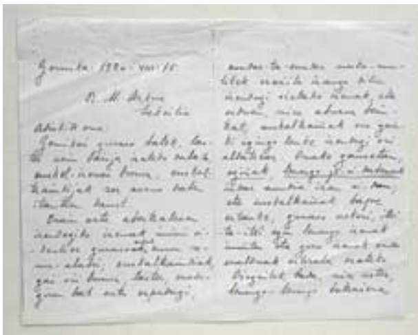
Resurrección María de Azkueri 1920an igorri zion eskutitz bat, arrasatearra euskaltzain izendatu eta berehala.