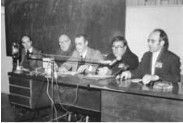
Euskaltzaindiaren IX. Biltzarrari eman zitzaion hasiera Arrasaten, 1979ko abenduaren 20an.