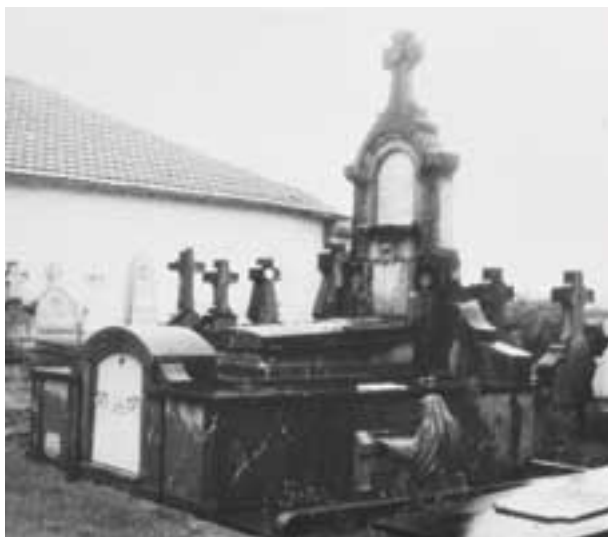
Hilobia Gernikako kanposantuan.

Jainkoak, Adanen bidez zigorkatu ginduzanez, lur bizitza igaro dozu pena askogaz, poz eskasez. Zerua irabazia dozu, bai! Nekaldi horren ordaiñez.