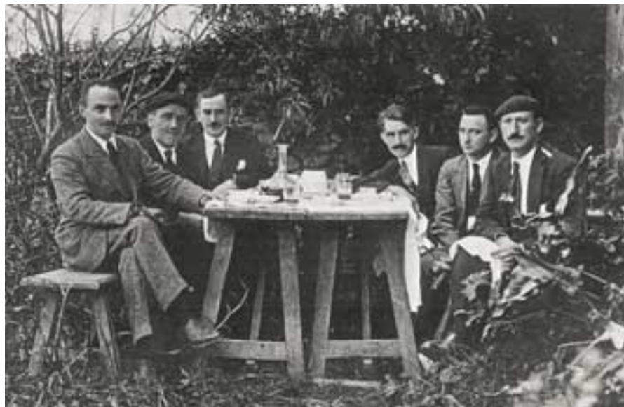
Gernikako lagunekin, bazkalondo batean.