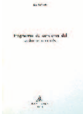
Ikertzaile asko erakarri zituen Erronkariko euskarak