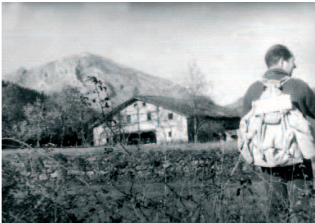
Juanito Untzillaitz mendiaren magalean. Ipuin, leienda eta hainbat pasadizoren iturburu

Bestalde, nahiz eta jarduera hartan orduan oraindik ohitura ez izan, aipaturiko alorretako lekukotasun asko euskaraz jasoko ditu aitzindari bihurtuko delarik langintza honetan.