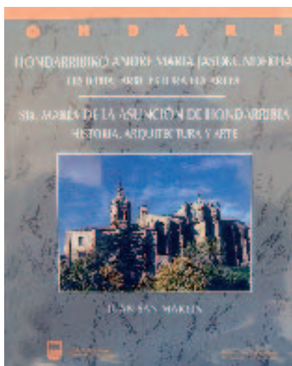
Bere bigarren bizilekuan ere denborari etekina lortzen jakin izan du