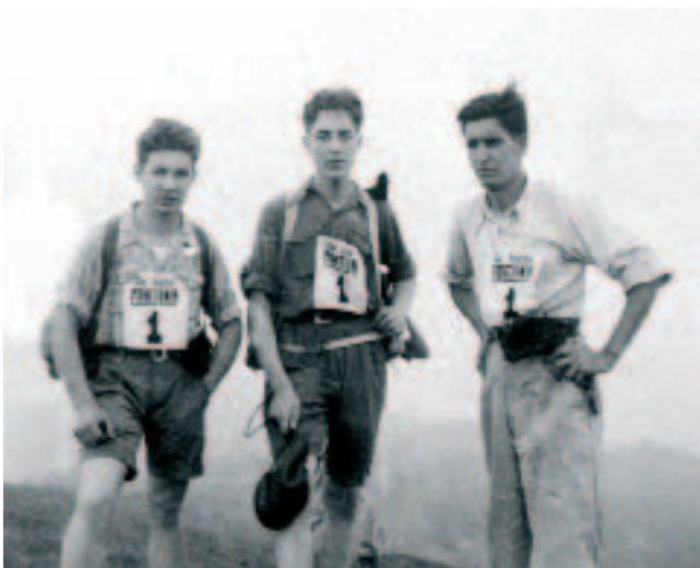
Donostiako Fortuna mendizale taldeak antolatutako ibilbide neurtuan beste bi adiskiderekin