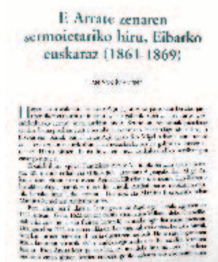
Eibarko Aginagako auzoko elizan F. Arrateren xix. mendeko sermoi sorta aurkitu zuen

Ildo honetan oso harrera ona jasoko duten bi liburu idatziko ditu San Martinek. Biak teoriarik geografian esparru jakin batera mugatuak baina han-hemenka oihartzun zabala jasoko dutenak. Zirikadak (1960) eta Eztenkadak (1965). Bi liburuok tematika bertsu darabilte: umorea, umore zabal, herrikoia, pasadizoz betea. Inor iraindu gabe, liburuon izenburua erabiliz, aldamenekoari zirikada