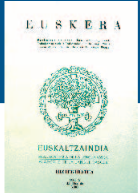
Hiztegi Batua euskaltzainen hasierako eginkizun zaila

Urte zailak datoz (zeintzuk ez euskararen historia hurbilean!), Euskaltzaindiaren eta San Martinen euskara batuaren aldeko apustuak giro katramilatsua ekarriko dio gure gizonari bere inguruan. Zenbait aldizkaritan idazle ezagun batzuek artikuluak, inoiz liburu