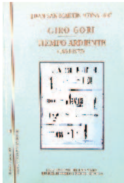
«Otsalar» olerkariaren lan bilduma

Juanitoren olerkigintzak baina hedaturaz handia izan ez bada ere, poetaren kezka agertzen du gizaki oro inarosten dituen galdetikizunen aurrean. 1954tik 1977 urte bitartean eginiko poesia Giro gori liburuan bildu