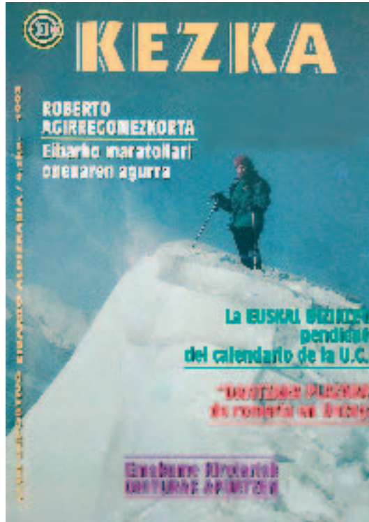
Kezka Eibarko mendizaleen aldizkaria