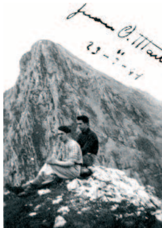
Mendia. Juanitoren zaletasun handia. Durangaldeko mendietan, Aitz txikin