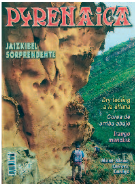
Pyrenaica aldizkaria. San Martinen lehenengo kroniken lekuko

Kultur basamortu hartan Eibarko gazte askok mendia aukeratuko dute aterpe. Juanitoren herrian gainera, bada 1924tik gazte jendea mendirantz bideratzen duen elkartea. Eibarko Club Deportibok, hain zuzen, debe-