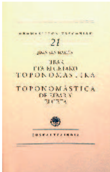
Eibar eta auzo herrietako historiaren ikertzaile nekagaitza