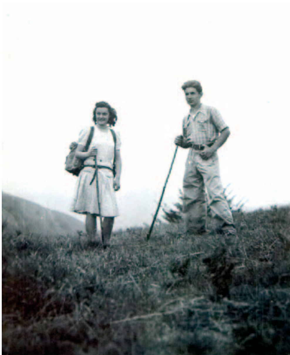
Mendia beti present San Martinen bizitzan